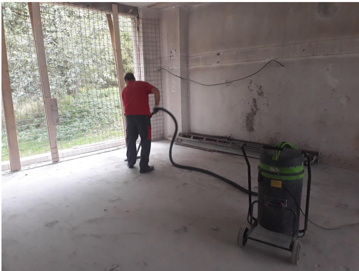
Čištění, příprava a nátěry pro izolace