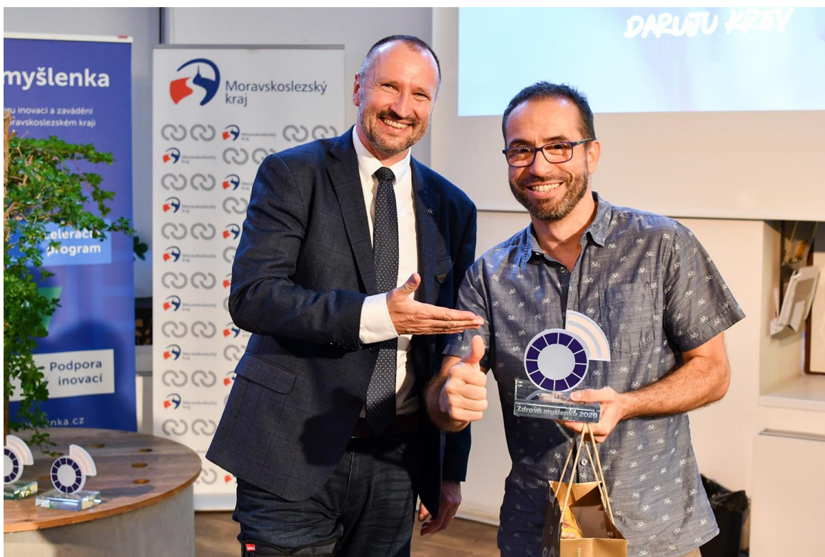
Dne 20. září absolutní vítězství projektu Moravskoslezského kraje Zdravá myšlenka