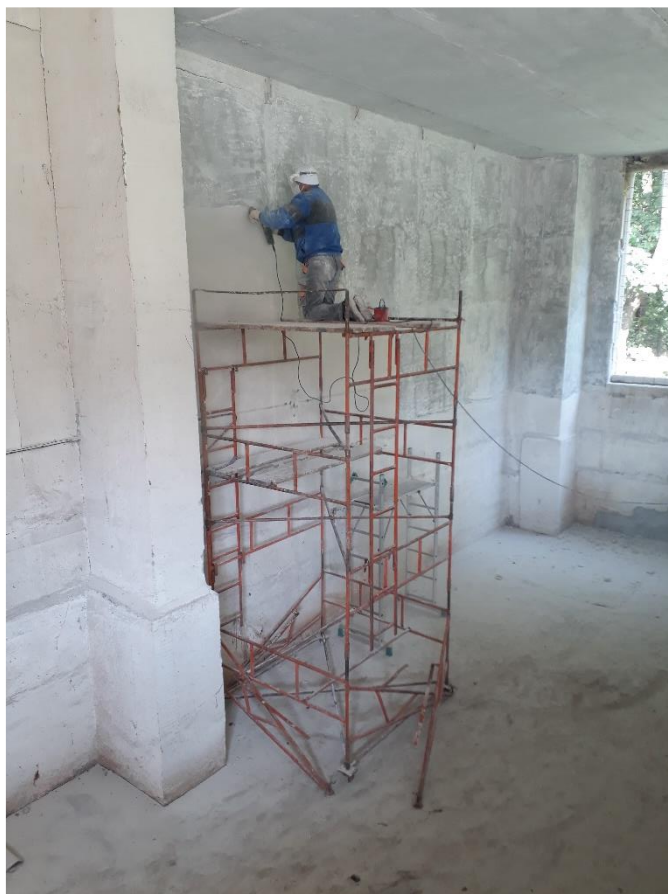
Broušení a čištění vnitřních prostor