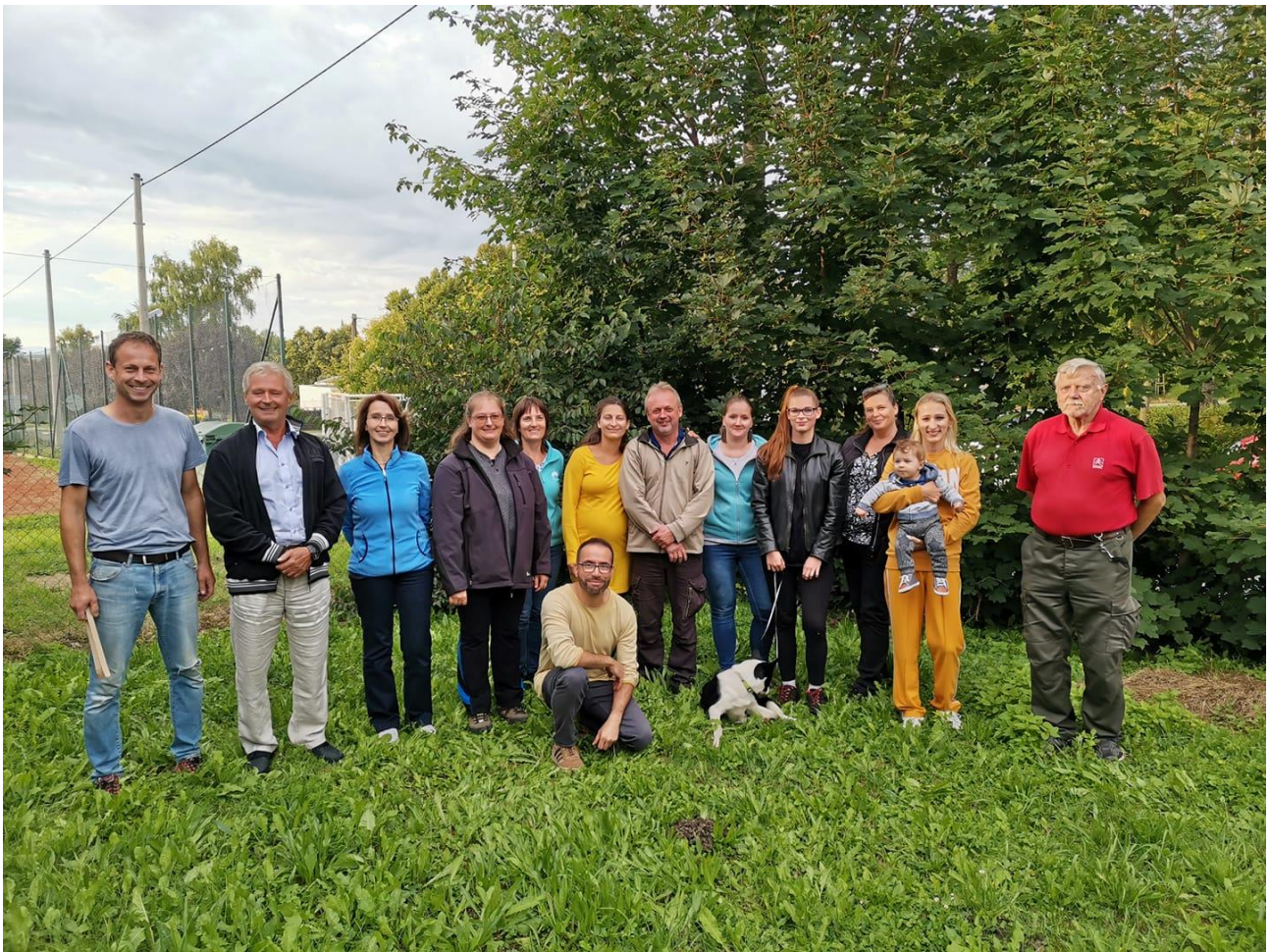
Dne 27. srpna schůze