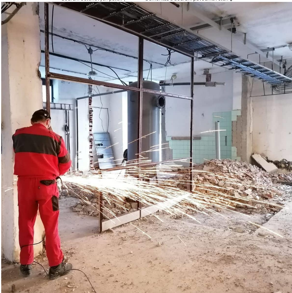
Demontáž a bourání původních stěn ↓