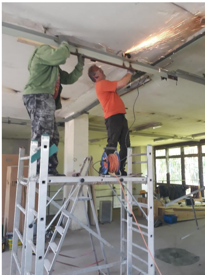
Demontáž původních ocelových profilů