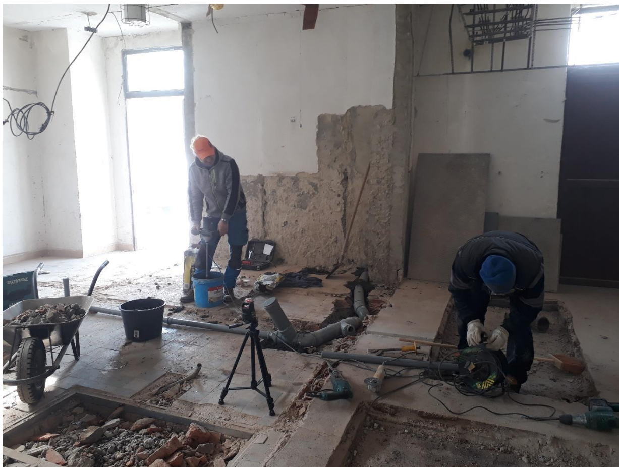
Příprava a pokládka nové kanalizace