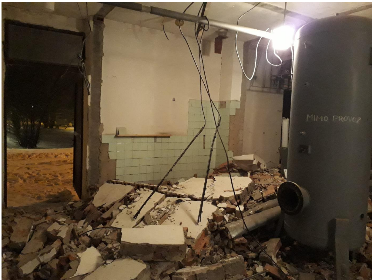
Vyklízení původního vybavení