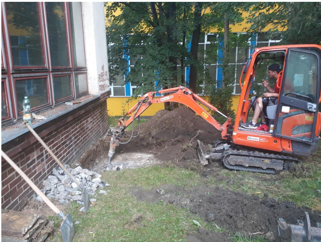
Odkopávání základů pro opravu izolace ↑