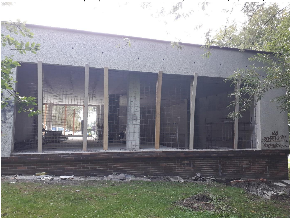
Zajištění vybouraných prostor ↓