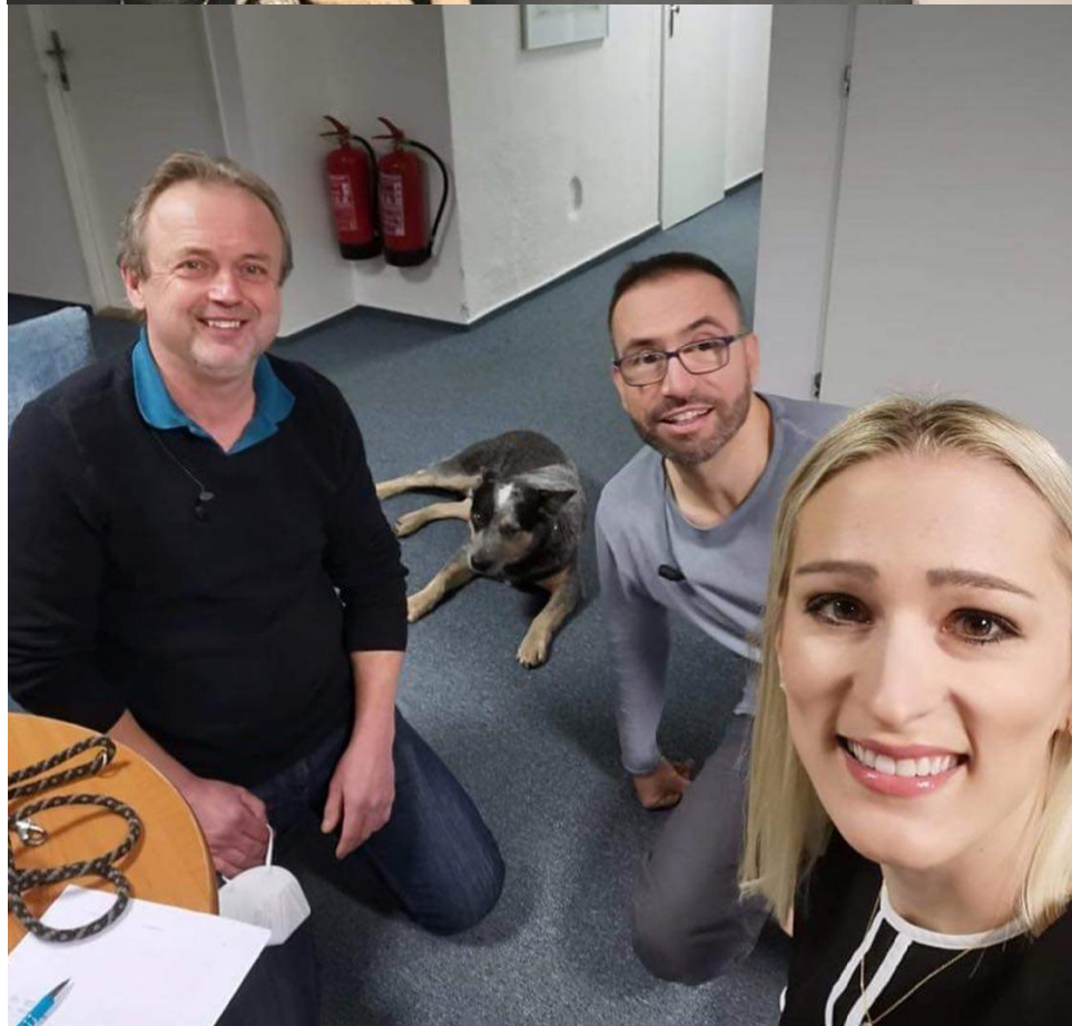
Dne 23. listopadu v pořadu Dobré ráno