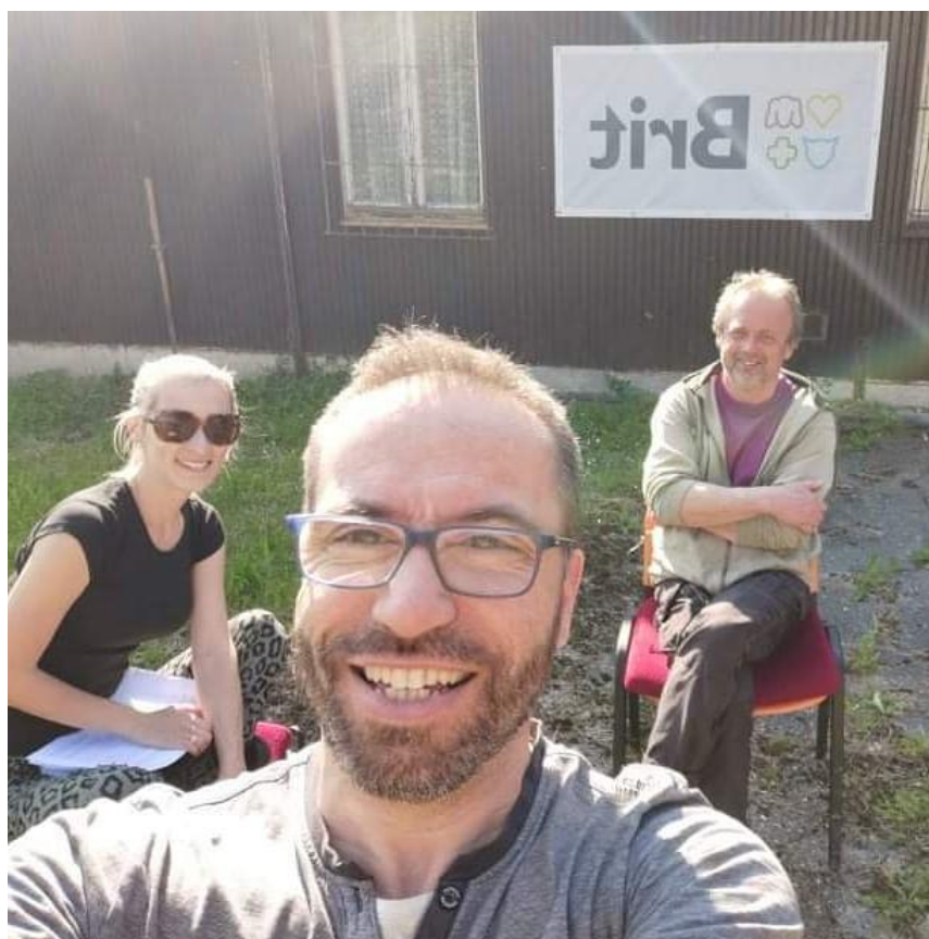
Dne 3. června jedna z mnoha schůzí vedení spolku, v areálu současných prostor