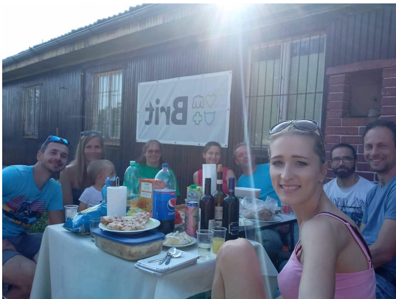
Dne 18. června výroční schůze zakládajících členů

www.signalnizvirata.cz email: info@signalnizvirata.cz