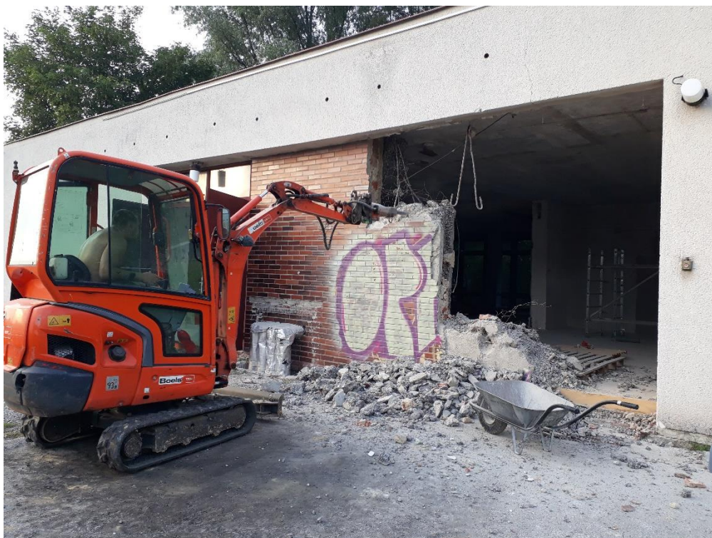
Bourání panelů ↑