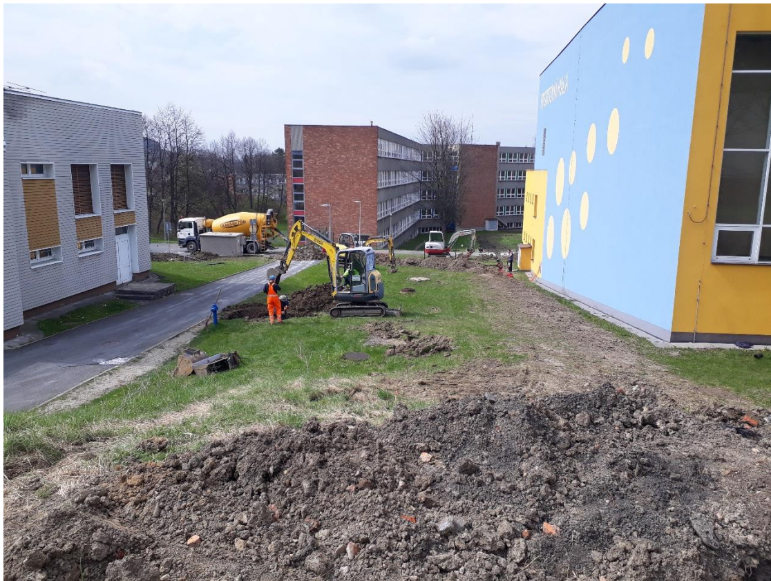
Kopání vodovodní přípojky