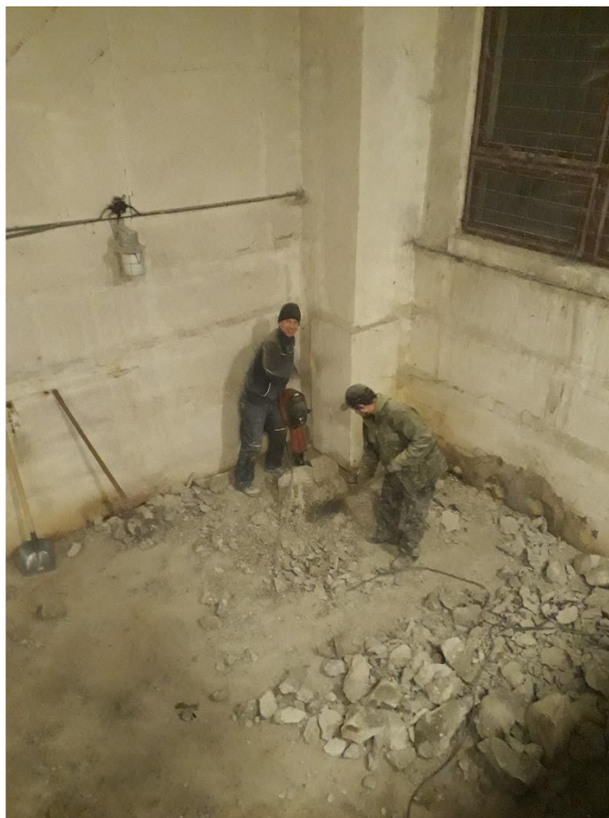
Sbíjení betonové patky ↑