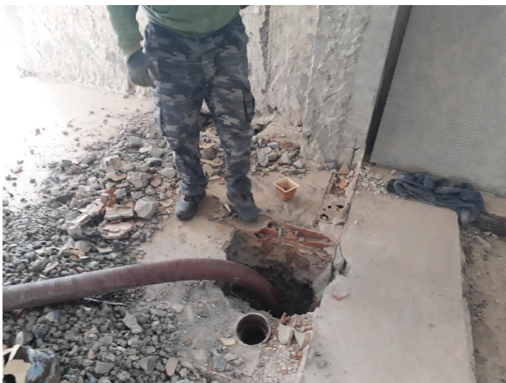
Proplach kanalizace ↓