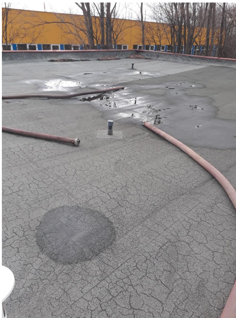
Čištění a proplach střešní vpustě ↑