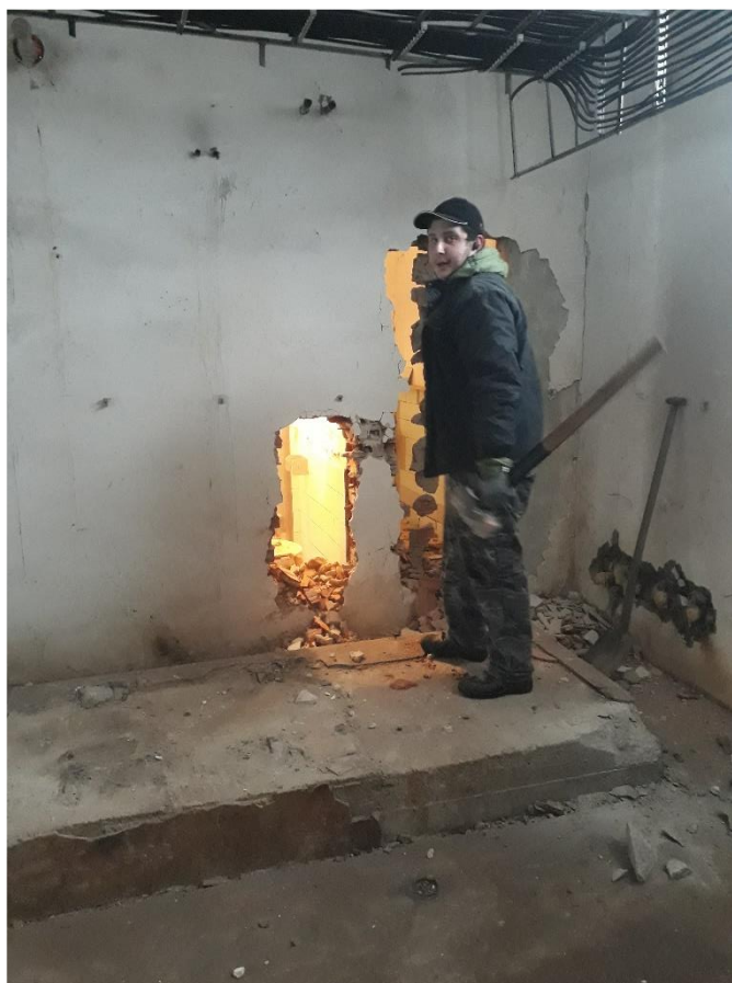
Bourání stěn ↓