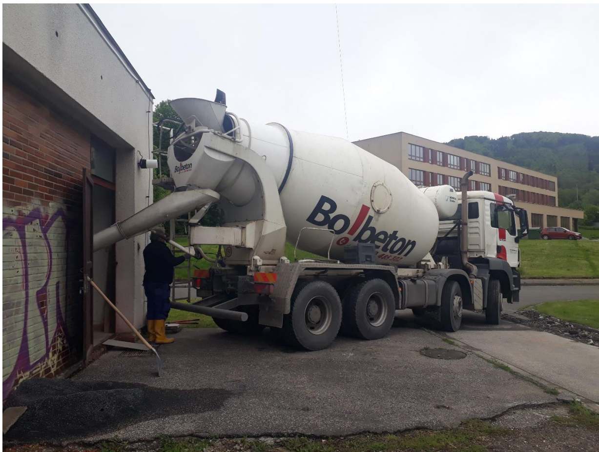
Betonáž – srovnávání podlahy