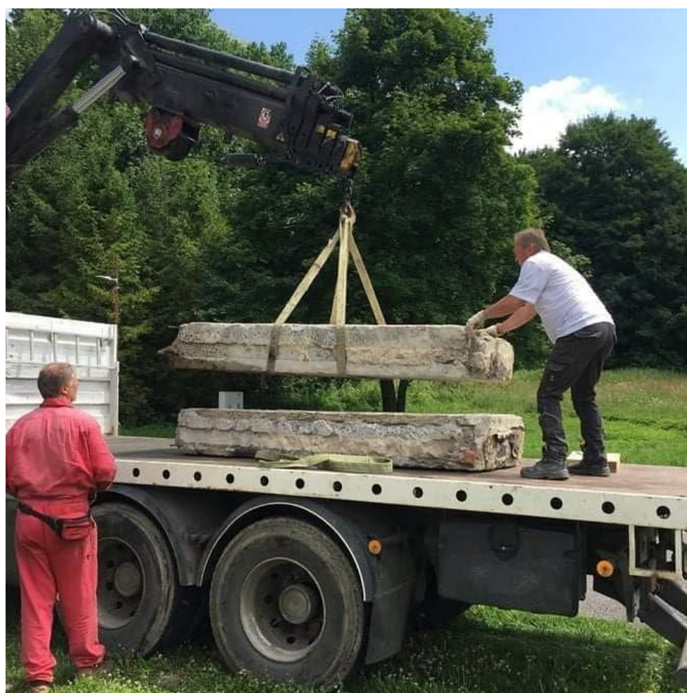
Nakládka a odklizení vybouraných panelů ↓