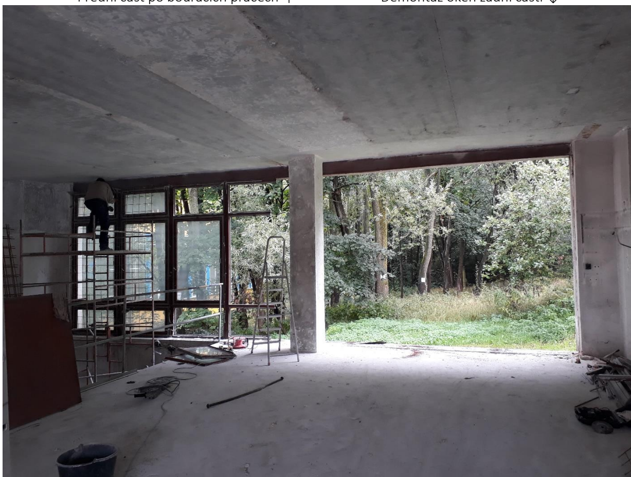
Demontáž oken zadní části ↓