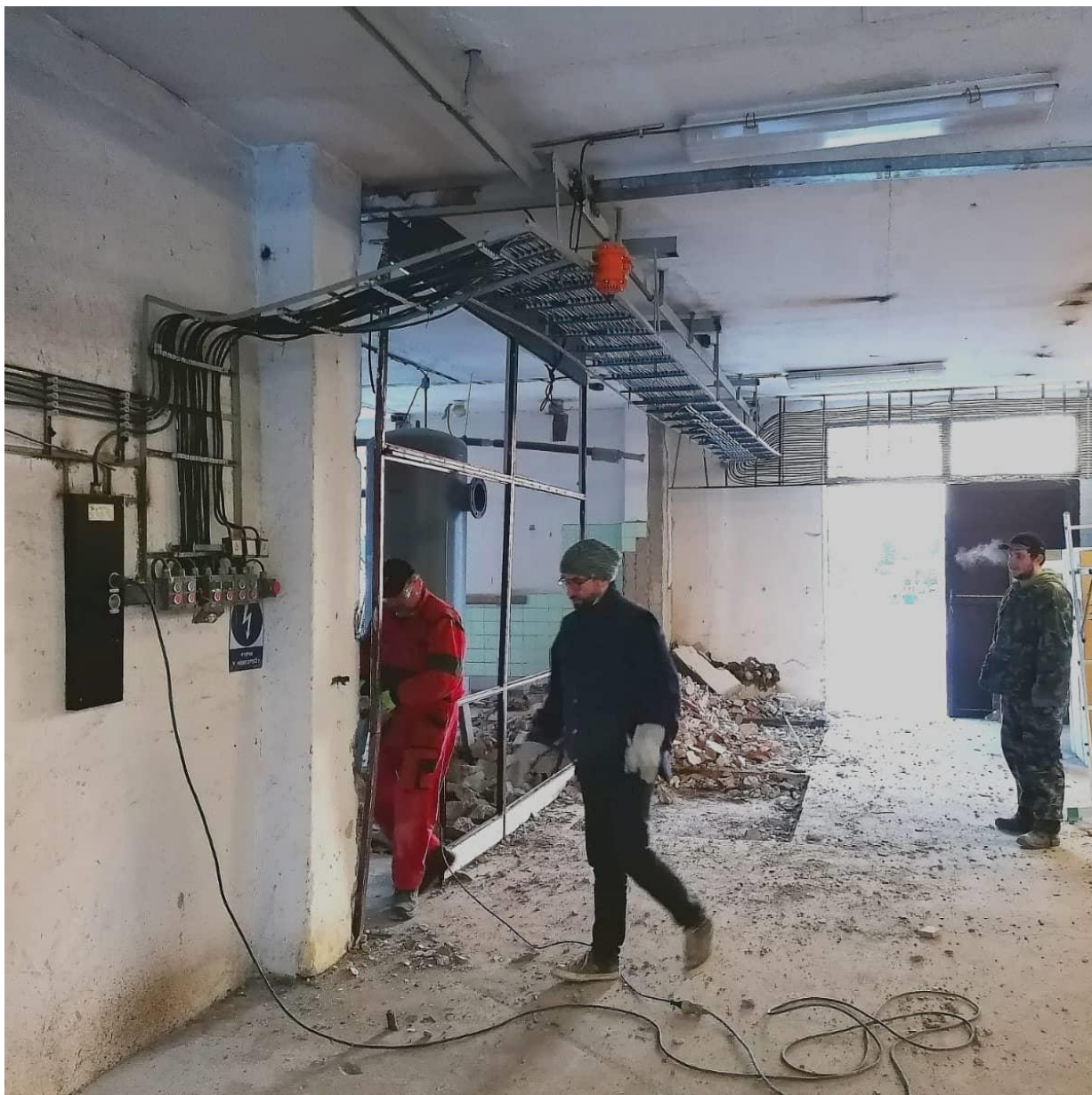
Bourání původních stěn ↑