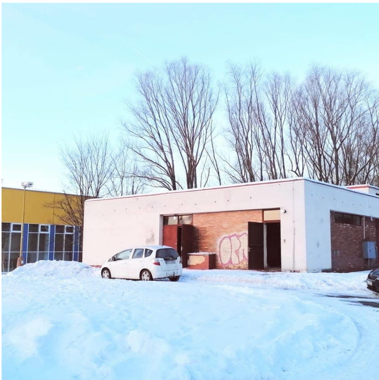
Budova v původním stavu