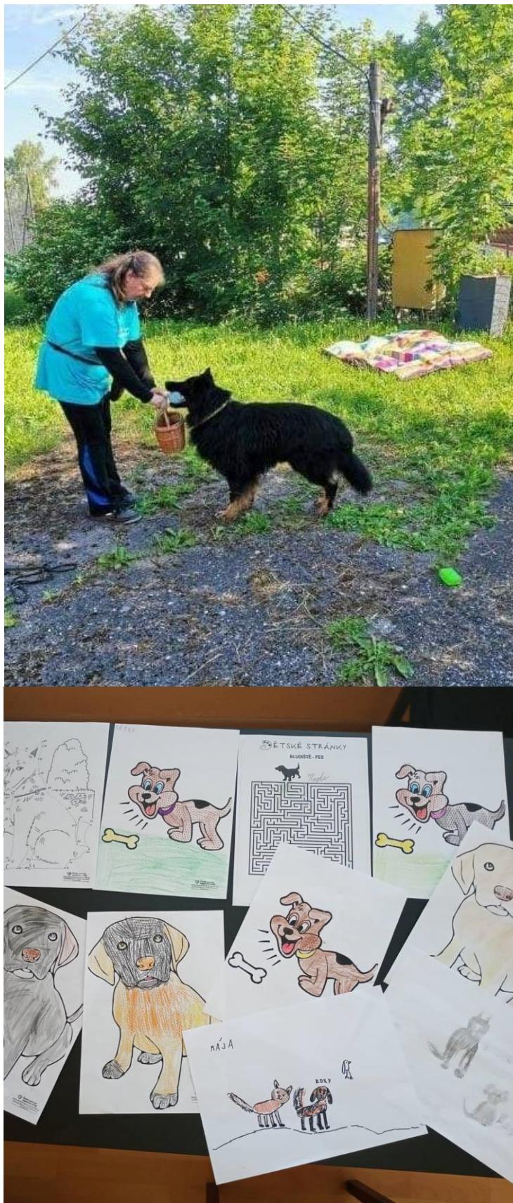
Dne 11. června, provedená akce pro děti ze MŠ a ZŠ v Kopřivnici