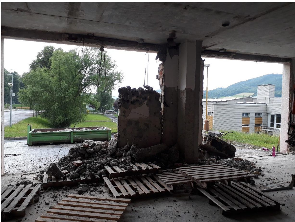
Přední část po bouracích pracích ↑