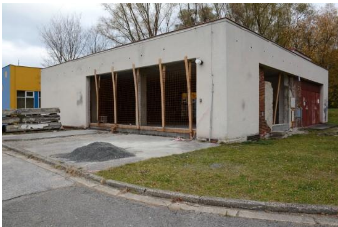
Kopřivnické noviny číslo 40/2021 ze dne 11.11.2021 V nové sídlo Centra signálních zvířat se starý výměník promění nejdřív za rok